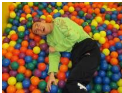
Terapeutický bazének od firmy Radek Herold-Herold

DĚKUJEME VŠEM DÁRCŮM, POMOCNÍKŮM, DOBROVOLNÍKŮM A LIDEM S DOBRÝM SRDCEM, KTERÍ ŽIVOTU BEZ BARIÉR POMOHLI A POMÁHAJÍ