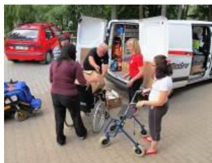
Dary pro klienty sociálních služeb od Firmy Cummins