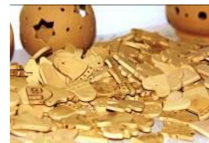
Keramická hlína pro chráněnou dílnu od Církve Ježíše Krista Svatých posledních dnů

Výtěžek ze slavnostního předávání cen MISTROVSTVÍ ČR pořádané Autoklubem v AČR Nová Paka