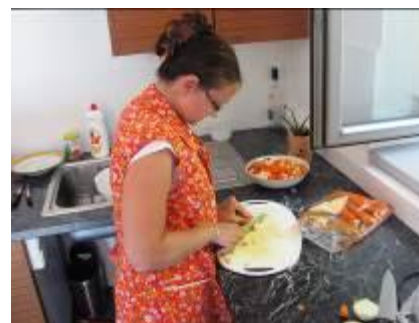
Cvičná kuchyň pro klienty sociální rehabilitace od nadace Preciosa

Děkujeme Vám, že pomáháte společně s námi!