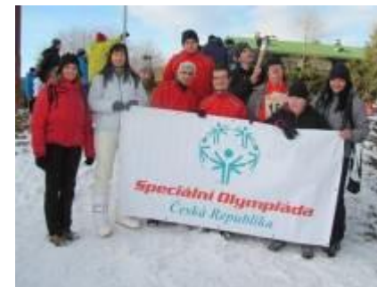
Účast na zimních hrách Speciálních olympiád díky Nadaci Charty 77

Děkujeme Vám, že pomáháte společně s námi!