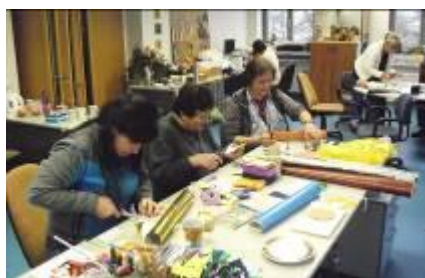
Pomoc dobrovolníků ze společnosti JILOS HORKA, s.r.o